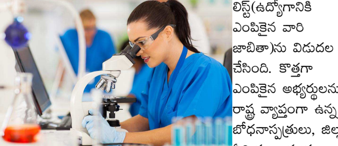
ల్యాబ్ టెక్నిషియన్ పోస్టులకు ఎంపికైన వారి జాబితాను విడుదల చేసింది. కొత్తగా ఎంపికైన అభ్యర్థులను రాష్ట్ర వ్యాప్తంగా ఉన్న బోధనాస్థులు, జిల్లా, ఏరియా ఆస్పత్రులు, ప్రాథమిక ఆరోగ్య కేంద్రాల్లో నియమించనున్నారు.

అందుబాటులో ఉంచింది. ఈ ఉద్యోగాలకు పరీక్ష రాసిన అభ్యర్థుల పైనల్ మెరిట్ లిస్టును ప్రభుత్వ అధికారిక వెబ్ సైట్ లో చెక్ చేసుకోవచ్చు. తెలంగాణ వైద్యారోగ్య శాఖలో 1,284 పోస్టులు భర్తీకి నోటిఫికేషన్ జారీ కాగా.. 24,045 మంది దరఖాస్తు చేసుకున్నారు. ఈ పోస్టులకు సంబంధించి పరీక్షను 2024, నవంబర్ 10వ తేదీన నిర్వహించారు. మొత్తం 23,323 మంది ఈ పరీక్షకు హాజరయ్యారు. మెరిట్ లిస్ట్ సిద్ధం చేసి.. సర్టిఫికెట్ల పరిశీలన పూర్తి చేసిన ప్రభుత్వం.. తాజాగా ఎనైల్ మెరిట్