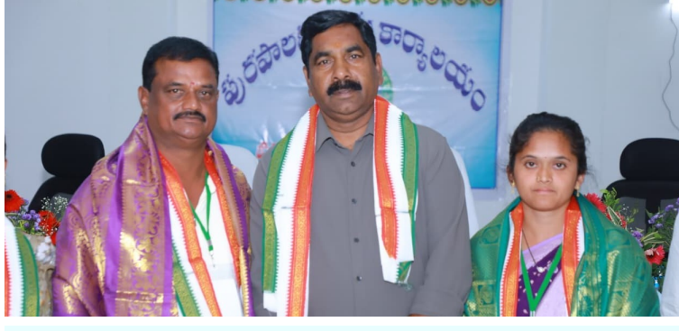
ఉమ్మడి వరంగల్ జిల్లా మంగళవారం 17, ఫిబ్రవరి, 2026

వరంగల్, హనుమకొండ, మహబూబాబాద్, జయశంకర్ భూపాలపల్లి, ములుగు, జనగాం