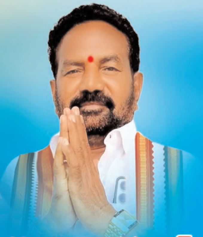
పోశాల వెంకన్న గౌడ్ జిల్లా కార్యకర్త నాయకులు