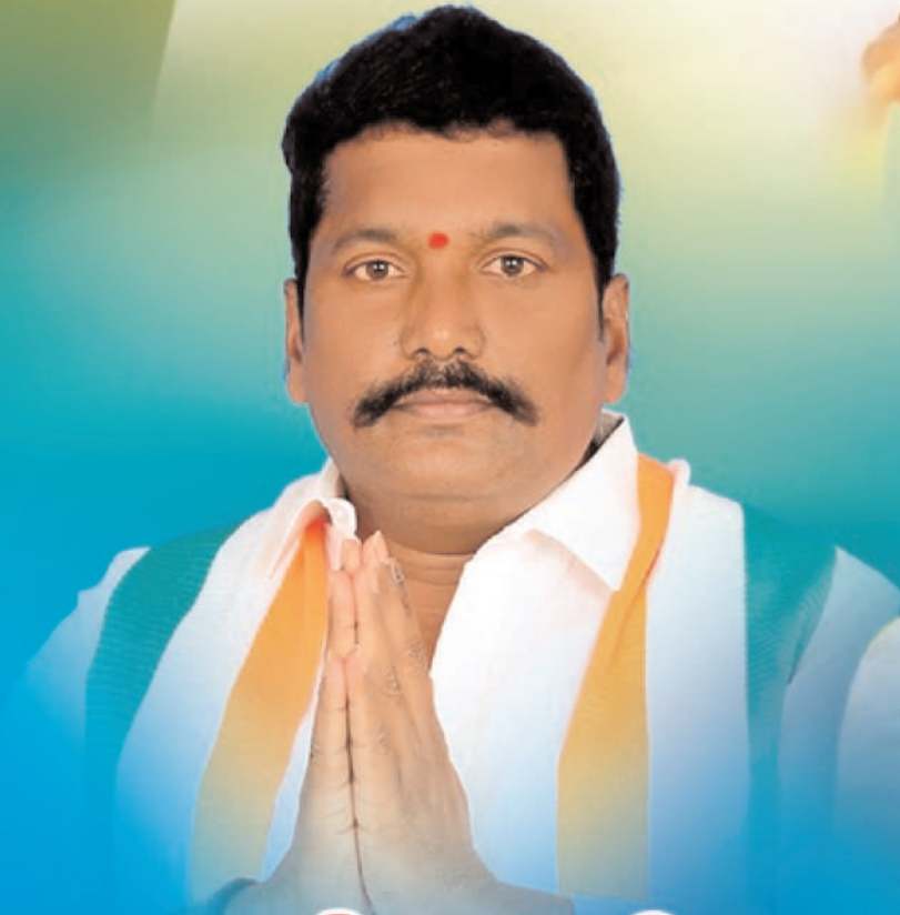
అబ్బిడి రాజిరెడ్డి బ్లాక్ కార్యకర్త అధ్యక్షులు వర్ధన్నపేట