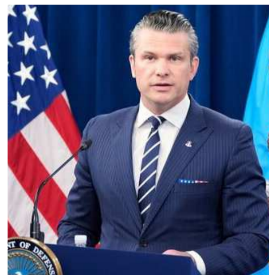
అమెరికాలో ఆశ్రయాన్ని కల్పించే ఎలాంటి ప్రణాళికలూ ప్రస్తుతానికి తమకు లేవని అమెరికా రక్షణ మంత్రి తేల్చి చెప్పారు.

బాలిస్టిక్ మిసైల్ లాంచ్ ప్యాడ్లపై వేశామని పేర్కొంది. అమెరికా సంకల్పం ఎంత బలమైందో ఇరాన్ అర్థం చేసుకోలేకపోతోందని అమెరికా రక్షణ మంత్రి పీట్ హెగ్గెట్ అన్నారు. ఇరాన్‌పై తమ సైనిక చర్యను బలంగా కొనసాగిస్తామని ఆయన స్పష్టం చేశారు. వాషింగ్టన్‌లో విలేకరుల సమావేశం వేదికగా పీట్ హెగ్గెట్ ఈ వ్యాఖ్యలు చేశారు. అమెరికాను ఇరాన్ నేతలు, ఐఆర్జీసీ తక్కువ అంచనా వేస్తున్నాయని ఆయన చెప్పారు. తమ సంకల్పానికి కట్టుబడి ఉంటామని, ఇరాన్‌పై పోరాటాన్ని కొనసాగిస్తామని వెల్లడించారు. పూర్తి శక్తితో అమెరికా ఇప్పుడే దాడులను మొదలుపెట్టినదన్నారు. ఒకవేళ అవసరమైతే దీర్ఘకాలం పాటు ఈ యుద్ధాన్ని చేసేందుకు అమెరికా సన్నద్ధమై ఉందని పేర్కొన్నారు. ఇరాన్ దాడుల నేపథ్యంలో అరబ్ దేశాల నుంచి అమెరికాకు శరణార్థులు క్యూ కట్టే ఛాన్స్ ఉందనే ప్రచారం జరుగుతోంది. అయితే అరబ్ శరణార్థులకు