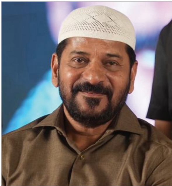
పెంపొందిస్తాయని ఆభిప్రాయపడ్డారు. తెలంగాణ రాష్ట్రం

హైదరాబాద్, మార్చి 20 (తరంగాలు ప్రతినీధి): రంజాన్ (ఈద్-ఉల్-ఫిత్ర్) పండుగ సందర్భంగా ముస్లిం సోదరి సోదరీమణులకు ముఖ్యమంత్రి ఎ. రేవంత్ రెడ్డి హృదయపూర్వక శుభాకాంక్షలు తెలిపారు. ఈ పవిత్ర పండుగను కుటుంబ సభ్యులు, బంధుమిత్రులతో ఆనందంగా జరుపుకోవాలని ఆకాంక్షించారు. రంజాన్ పండుగ తొలికవాలానికి, మత సామరస్యానికి ప్రతీకగా నిలుస్తుందని ఆయన పేర్కొన్నారు. రంజాన్ మాసం ఆధ్యాత్మికతకు, నియమ నిష్ఠలకు ప్రతీకగా నిలుస్తుందని సీఎం అన్నారు. ఈ నెలలో ముస్లింలు పాటించే కఠిన ఉపవాసాలు, క్రమశిక్షణతో చేసే ప్రార్థనలు, జకాత్, ఫిత్రా రూపంలో పేదలకు సహాయం చేయడం మానవాళికి గొప్ప సందేశమని ఆయన తెలిపారు. ఈ అవకాశాల సమాజంలో సహనభూతి, సేవాభావాన్ని