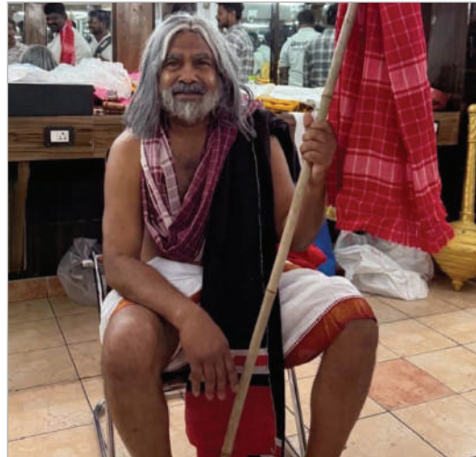
చేస్తూ, సాంస్కృతిక వారసత్వాన్ని వెలుగులోకి తీసుకువచ్చారు.