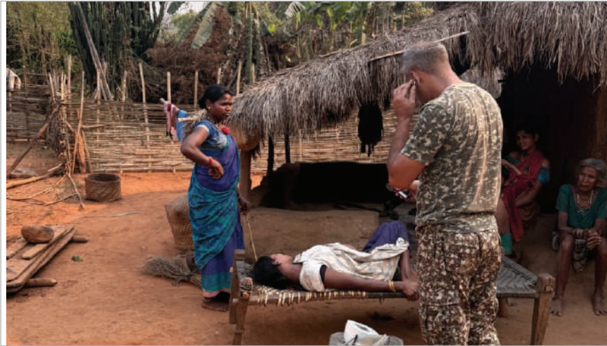
గర్మిణి భుజాలపై మోసిన ఐటీఐపి జవాన్లు