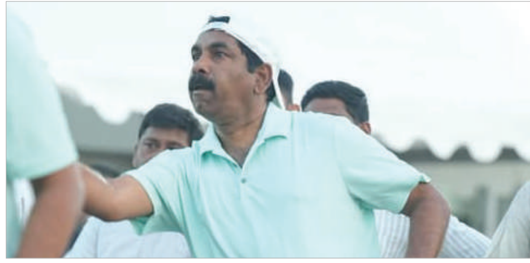
నియోజకవర్గ ఎమ్మెల్యే, విశ్రాంత

హైదరాబాద్, మార్చి 29, తరంగాలు : స్పోర్ట్స్ మీట్ ద్వారా ప్రజల్లో క్రీడలపై ఆసక్తి మరింత పెరుగుతుందని వర్ణనపేట ఎమ్మెల్యే కే ఆర్ నాగరాజు ఆశాభావం వ్యక్తం చేశారు. హైదరాబాద్ లోని ఎల్సీ స్టేడియంలో నిర్వహిస్తున్న "ఫస్ట్ ఎడిషన్ అఫ్ తెలంగాణ లెగిస్లేటర్స్ ' సోషల్స్ అండ్ కల్చరల్ మీట్ -2026" కార్యక్రమంలో భాగంగా వర్ణనపేట