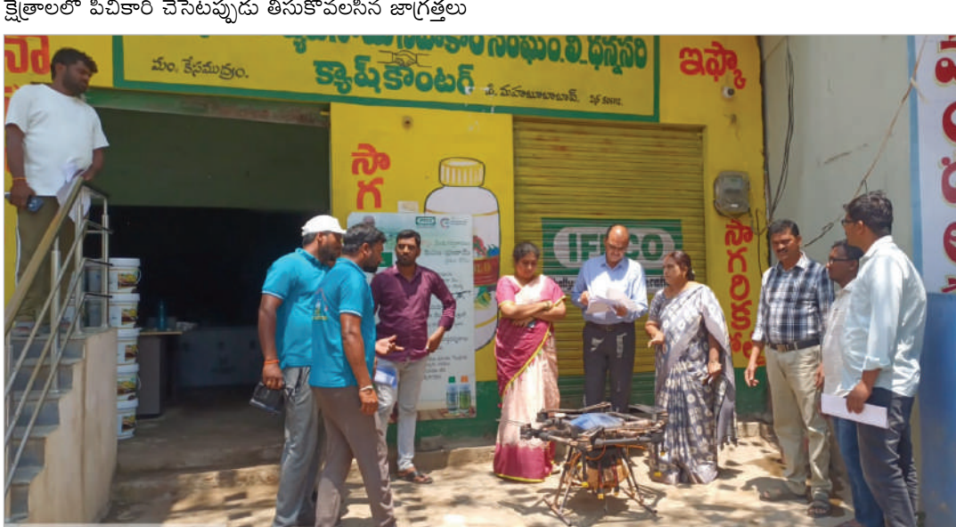
క్షేత్రాలలో పిచికారి చేసేటప్పుడు తీసుకోవలసిన జాగ్రత్తలు