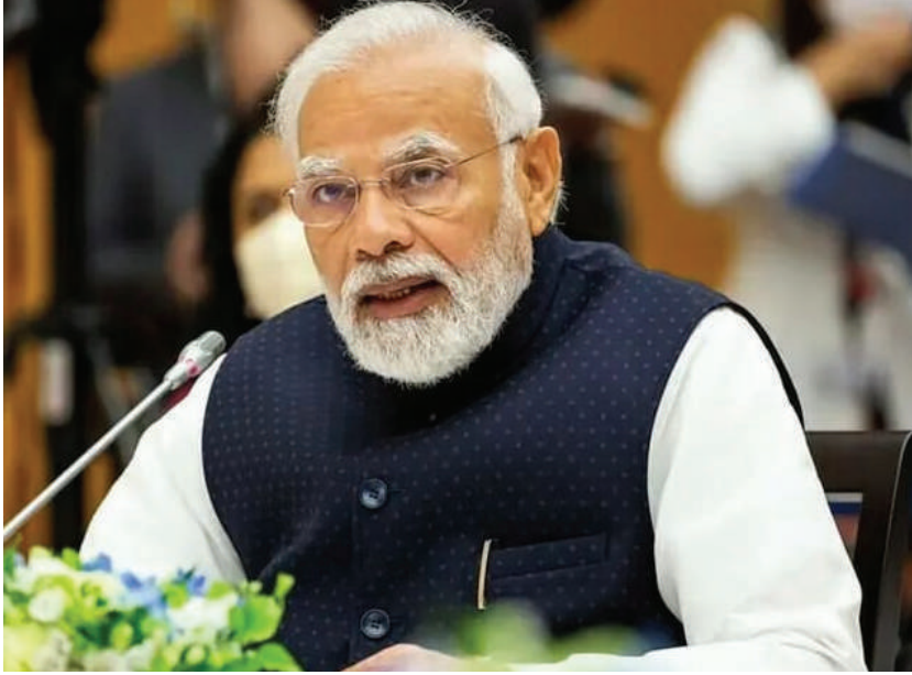
దేశంలో నీటి భద్రతను బలోపేతం చేయడమే కాకుండా

• ప్రధానమంత్రి నరేంద్ర మోదీ • జల్ జీవన్ మిషన్ పై కేబినెట్ కీలక నిర్ణయం • మౌలిక వసతుల నుంచి నీటి అందింపుపై దృష్టి • గ్రామీణ మహిళల సాధికారతకు తోడ్పాటు న్యూఢిల్లీ, 10 మార్చి (తరంగాలు ప్రతినిధి): దేశవ్యాప్తంగా గ్రామీణ గృహాలకు స్థిరమైన తాగునీటి సరఫరా అందించేందుకు కేంద్ర కేబినెట్ కీలక నిర్ణయం తీసుకున్నట్లు ప్రధానమంత్రి నరేంద్ర మోదీ తెలిపారు. జల్ జీవన్ మిషన్ కార్యక్రమాన్ని మరింత బలోపేతం చేస్తూ తీసుకున్న ఈ నిర్ణయం గ్రామీణ ప్రజలకు పెద్ద ఉపశమనం కలిగిస్తుందని ఆయన పేర్కొన్నారు. ఇప్పటివరకు మౌలిక వసతుల సృష్టిపైనే దృష్టి పెట్టిన ఈ పథకం ఇకపై ప్రజాకేంద్రిత సేవల అందింపుపై దృష్టి సారించనుందని ప్రధానమంత్రి చెప్పారు. స్థానిక పాలన వ్యవస్థల భాగస్వామ్యంతో పాటు డిజిటల్ పర్యవేక్షణ ద్వారా తాగునీటి సరఫరా వ్యవస్థను మరింత సమర్థంగా అమలు చేయనున్నట్లు తెలిపారు. ఈ నిర్ణయం