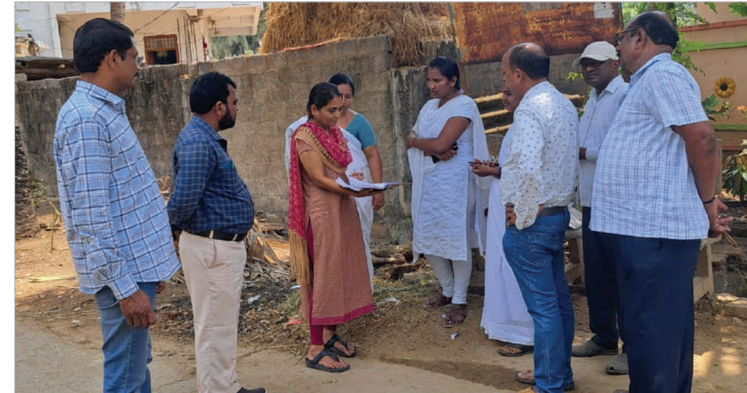
తరంగాలు, ఏప్రిల్ :06, నర్సంపేట నియోజకవర్గ ప్రతినిధి