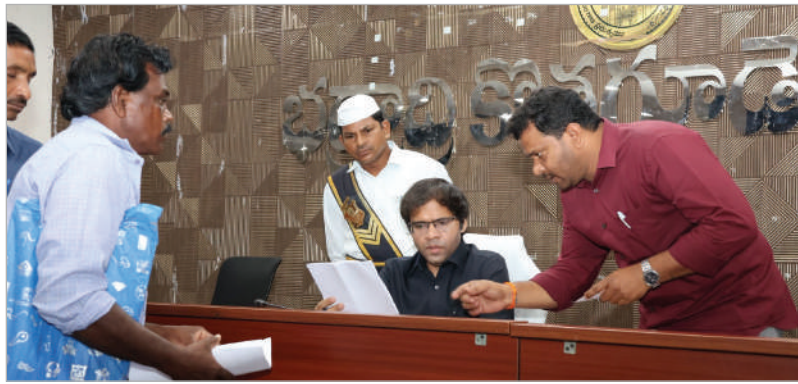
భద్రాద్రి జిల్లా బ్యూరో తరంగాలు న్యూస్ ఏప్రిల్ 6

ప్రజావాణి దరఖాస్తులకు తక్షణ పరిష్కారం అధికారులకు కలెక్టర్ అంకిత్ కలిసే ఆదేశాలు