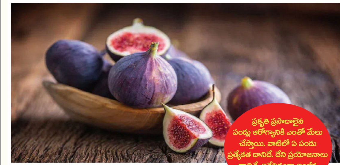
ప్రత్యేక ప్రసాదాలైన పండ్లు ఆరోగ్యానికి ఎంతో మేలు చేస్తాయి. వాటిలో ఏ పండు ప్రత్యేకత దానిదే. దీని ప్రయోజనాలు దానివే. అదేవిధంగా అంజీర పండ్ల

తగిలించే పనికి రూ.900 తీసుకున్నాడని ఆశ్చర్యాన్ని వ్యక్తం చేశాడు. అది కూడా కేవలం 45 నిమిషాల్లోనే ఈ పని ప్రారంభించి.. పూర్తి చేశారని వివరించారు. దీనిని బట్టి చూస్తే శారీరక శ్రమతో కూడిన ఉద్యోగాలకే భవిష్యత్తు ఉందన్నారు. కాలం చెల్లిన డిగ్రీల కంటే యువత.. నైపుణ్య ఆధారిత శిక్షణకు ప్రాధాన్యత ఇవ్వాలని అభిప్రాయపడ్డారు. అలా అయితే వాటికి ఏవ నుంచి ఎలాంటి ముప్పు వాటిల్లదని చెప్పుకొచ్చారు. ముంబైలో సైతం.. గత నెలలో ముంబైకి చెందిన ఫుంబర్ ఏడాదికి రూ. 18 లక్షలు సంపాదిస్తున్నట్లు వెల్లడించారు. మీరా రోడ్డు, బోరివాలి, కాండివాల్ టోన్ షిప్ సోసైటీలో ఫుంబర్ గా పని చేసి ఈ మొత్తాన్ని సంపాదిస్తున్నట్లు తెలిపారు. అంతేకాకుండా.. అతనికి ఖరీదైన కారుతోపాటు సొంతిల్లు సైతం ఉన్నాయని వివరించాడు. ఇటీవల వ్యవసాయ భూమిని కూడా కొనుగోలు చేసినట్లు చెప్పుకొచ్చారు. ఈ సందర్భంగా ఈ విషయాన్ని బెంగళూరుకు చెందిన వ్యక్తి గుర్తు చేశారు. ఎటువంటి ముప్పు ఉండదని నెటిజన్లు కామెంట్లు రూపంలో అభిప్రాయాన్ని వ్యక్తం చేస్తున్నారు.