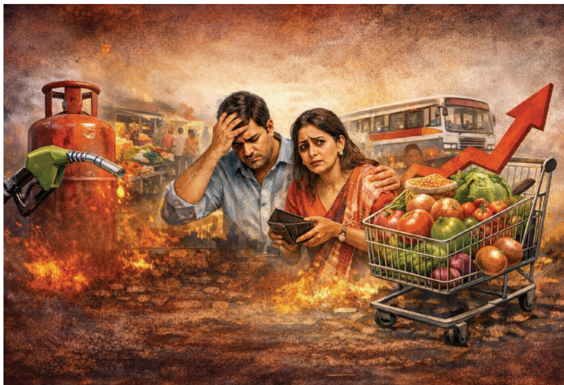
నెలలో జరిగిన పెంపు తర్వాత ధరలు స్థిరంగా ఉన్నప్పటికీ, పెను భారంగా మారింది. మరోవైపు కమర్షియల్ సిలిండర్ వెయ్యి రూపాయలకు దగ్గరగా ఉండటం పేద కుటుంబాలకు ధరలు ఏప్రిల్ 1న భారీగా

మధ్యతరగతి గుండెల్లో గుబులు వంటగ్యాస్, పెట్రోల్ ధరల సెగ రవాణా ఛార్జీల పెరుగుదలతో పైసెకి కూరగాయల ధరలు సామాన్యుడి నెలవారీ బడ్జెట్ తలకిందులు ?డెన్స్, ఏప్రిల్ 02 (తరంగాలు ప్రతినీధి): దేశవ్యాప్తంగా నిత్యావసర వస్తువుల ధరలు ఆకాశాన్ని తాకుతుండటంతో సామాన్య, మధ్యతరగతి ప్రజల జీవితాలు అతలాకుతలమవుతున్నాయి. ముఖ్యంగా ఏప్రిల్ నెల ప్రారంభం నుండి ధరల మంట మొదలైంది. అంతర్జాతీయ మార్కెట్లో క్రూడాాయిల్ ధరలు పెరగడం, పశ్చిమ ఆసియాలో నెలకొన్న ఉద్రిక్తతల వల్ల రవాణా వ్యవస్థపై తీవ్ర ప్రభావం పడుతోంది. హైదరాబాద్ వంటి మెట్రో నగరాల్లో పెట్రోల్ ధర లీటరుకు రూ. 107 దాటగా, డీజిల్ ధర కూడా రూ. 96 మార్కును సమీపించింది. ఇంధన ధరల పెరుగుదల ప్రభావం నేరుగా నిత్యావసర వస్తువుల సరఫరాపై వడి, మార్కెట్లో ప్రతి వస్తువు ధర రెట్టింపు కావడంతో వినియోగదారులు ఆందోళన చెందుతున్నారు. వంటగ్యాస్ సిలిండర్ ధరలు కూడా సామాన్యుడి నడ్డి విరుస్తున్నాయి. ప్రస్తుతం హైదరాబాద్లో డొమెస్టిక్ ఎల్పీజీ (14.2 కిలోల) సిలిండర్ ధర సుమారు రూ. 965కి చేరుకుంది. గత మార్చి