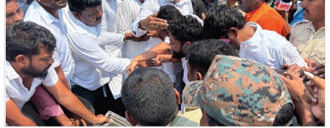
60 లక్షల మంది సామాన్య ప్రయాణికులు ఇబ్బందులు

పడుతుంటే ఈ ప్రభుత్వానికి కనీస సోయి లేదు. పవిత్ర గ్రంథాలు, మ్యానిఫెస్టోలు పట్టుకుని 100 రోజుల్లోనే సమస్యలు పరిష్కరిస్తామని ప్రగల్భాలు పలికిన కాంగ్రెస్ ప్రభుత్వం, ఇన్ని రోజులు గడుస్తున్నా కార్మికులను మోసం చేస్తూనే ఉంది. గత ప్రభుత్వం కూడా ఇదే తరహాలో ఉక్కుపాదం మోపి కార్మికుల ఉసురు తీసింది. మ్యానిఫెస్టోలో ఇచ్చిన హామీలను కాంగ్రెస్ ప్రభుత్వం వెంటనే అమలు చేయాలి. ఆర్టీసీ కార్మికుల న్యాయమైన డిమాండ్లకు, వాళ్ళ ధర్మ పోరాటానికి భారతీయ జనతా పార్టీ సంపూర్ణ మద్దతు ప్రకటిస్తోంది. కార్మికులకు నాదోకట్టే విజ్ఞప్తి... దయచేసి అత్యుచిత్యలు చేసుకోవద్దు, మన హక్కుల కోసం ఉండి కొట్లాడదాం, బిజెపి మీకు అండగా ఉంటుందని కేంద్ర హోంశాఖ సహాయ మంత్రి బండి సంజయ్ తెలిపారు.