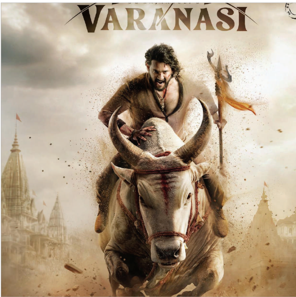
సందర్భంగా రాజమౌళి పంపిన వీడియో మెసేజ్ ఇప్పుడు గ్లోబల్ వైరల్ అవుతోంది.