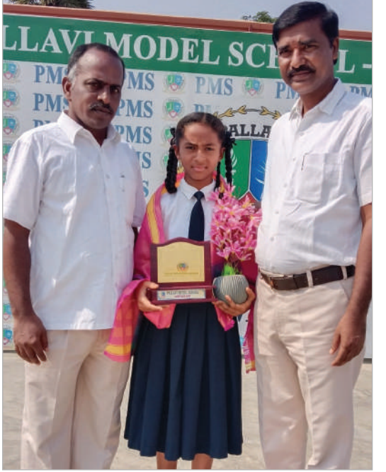
హర్షం వ్యక్తం చేసిన పాఠశాల యాజమాన్యం వర్ధన్గిరి, ఏప్రిల్ 13, తరంగాలు : విద్యతో పాటు క్రీడలకు సమాన ప్రాధాన్యతనిస్తూ విద్యార్థుల