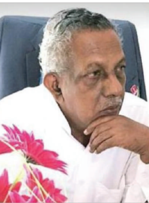
వరంగల్ జిల్లా ప్రతినిధి, ఏప్రిల్ 1, (తరంగాలు)