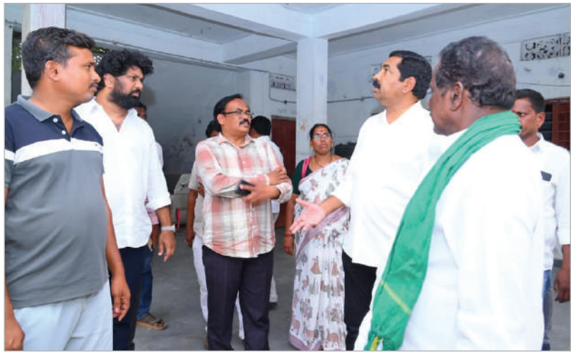
వర్కన్మేట ప్రతినిధి, ఏప్రిల్ 27, తరంగాలు :