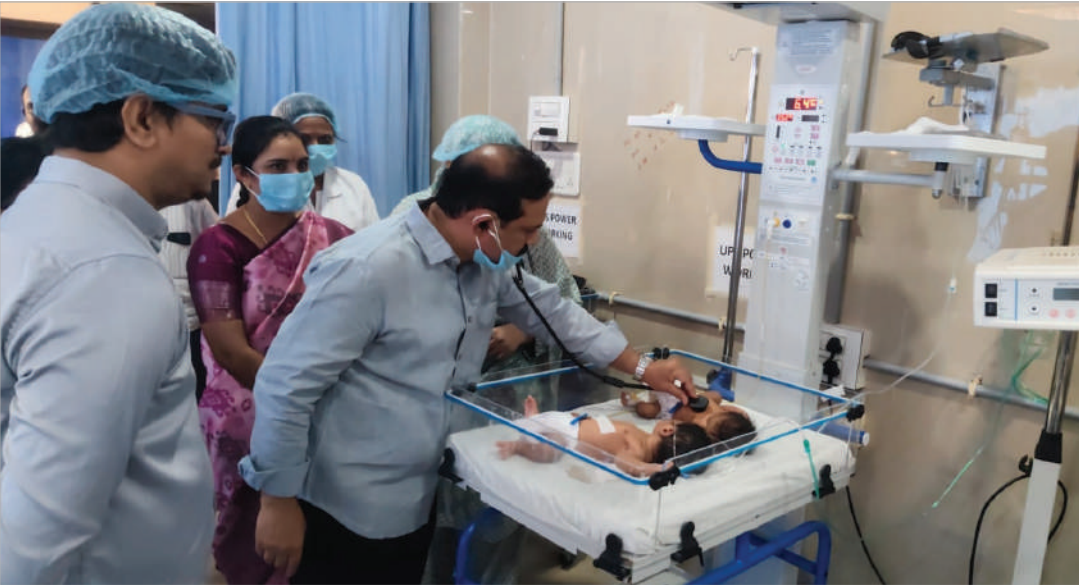
తప్పవన్నారు. లక్షల రూపాయలు జీతాలను ప్రజలు చెల్లిస్తున్న పన్ను ద్వారా తీసుకుంటు ఎందుకు ప్రజలకు