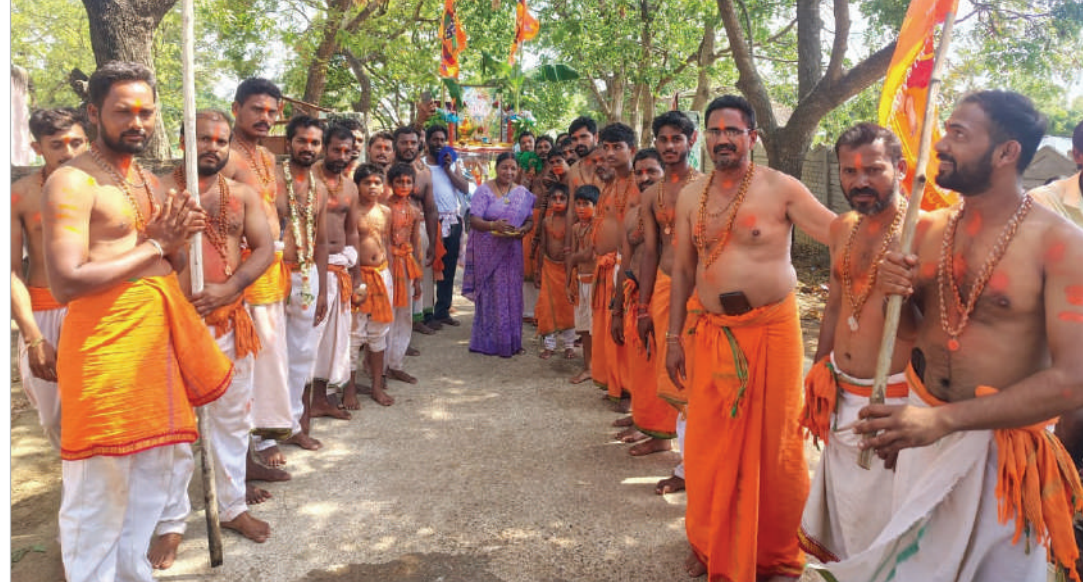
హనుమాన్ పరవతి సంఘం ఆధ్వర్యంలో ఖానాపూరం, మే 09, తరంగాలు : ఖానాపూరం మండలం అశోక్ నగర్ గ్రామం లో హనుమాన్ పరవతి అధిక సంఖ్యలో పాల్గొన్న హనుమాన్ స్వాములు భక్తులు