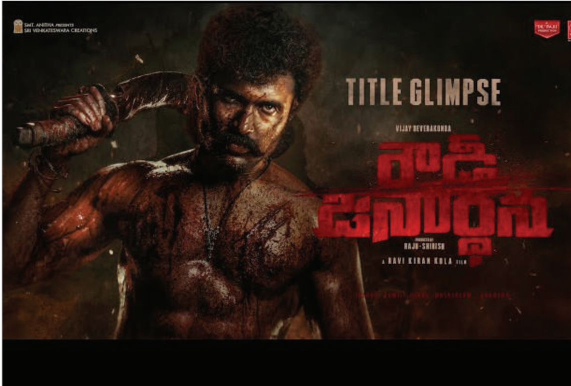
విజయ్ ఇంటెన్స్ లుక్ అందరినీ ఆకట్టుకుంటోంది. అతడి గుండెపై హీరోయిన్ కాలుపెట్టగా.. ప్రపంచంతో పోరాడే మొండివాడు.. కానీ ప్రేమకు మాత్రమే తలవంచుతాడు అంటూ ఈ పోస్టర్ కి క్యాప్షన్ ఇచ్చారు. కీర్తి సురేశ్ కథానాయికగా నటిస్తున్న ఈ చిత్రాన్ని శ్రీ వెంకటేశ్వర్ క్రియేషన్స్ బ్యానర్ పై భారీ బడ్జెట్ తో నిర్మిస్తున్నారు.