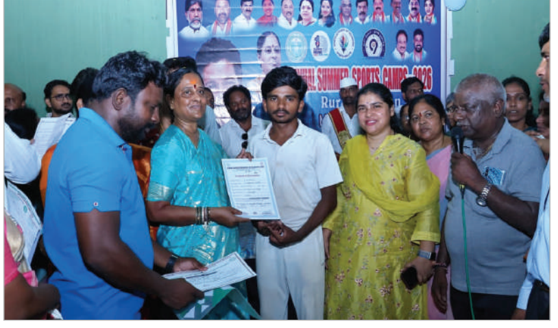
పర్యావరణ దేవదాయ శాఖ మంత్రి కొండా సురేఖ