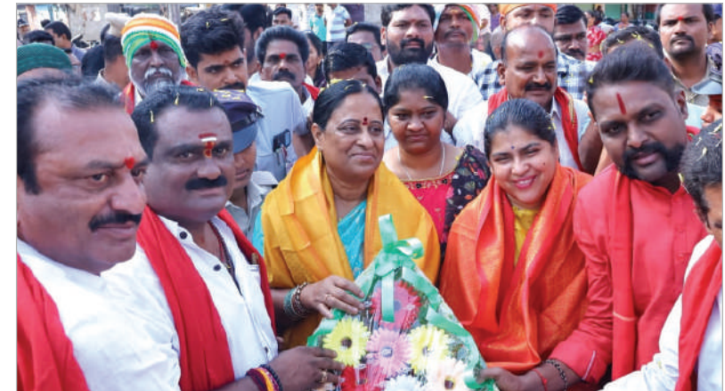
పర్యావరణ, అటవీ దేవదాయ శాఖ మంత్రి కొండా సురేఖ