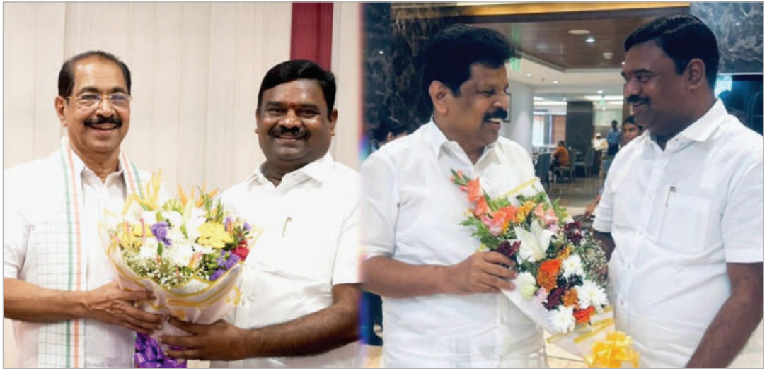
పదవీకాలం ప్రజలకు మేలు చేసే విధంగా ఉండాలని హృదయపూర్వకంగా ఆకాంక్షించారు.