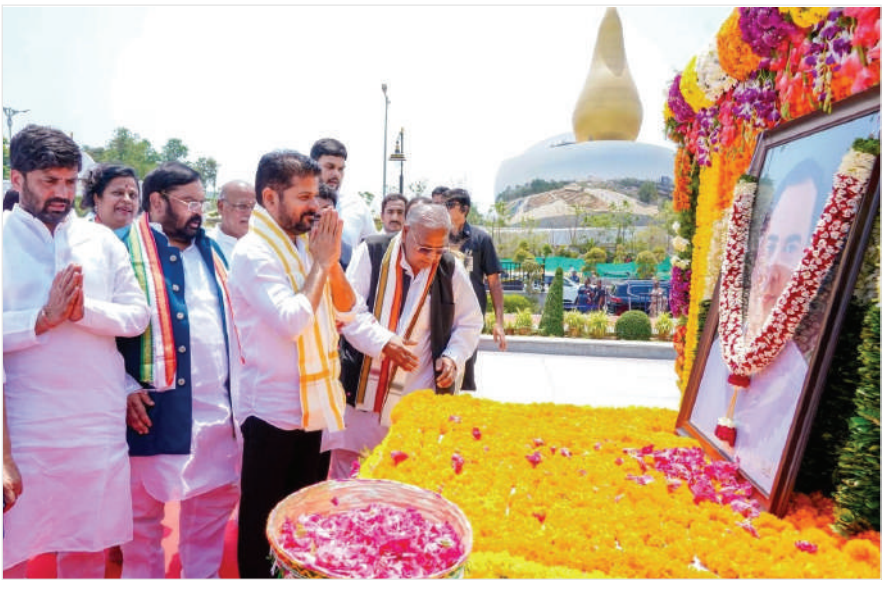
ఇరవై ఒకటో శతాబ్దంలో దేశం సాంకేతిక రంగంలో

హైదరాబాద్, మే 21 మాజీ ప్రధానమంత్రి, భారతరత్న రాజీవ్ గాంధీ స్మార్తితో తెలంగాణలో అభివృద్ధి, సంక్షేమ కార్యక్రమాలను ముందుకు తీసుకెళ్తున్నామని ముఖ్యమంత్రి ఎ. రేవంత్ రెడ్డి పేర్కొన్నారు. రాజీవ్ గాంధీ పరంపర సందర్భంగా హైదరాబాద్ లోని డాక్టర్ బీఆర్ అంబేద్కర్ సచివాలయం ఎదుట ఏర్పాటు చేసిన ఆయన విగ్రహానికి ముఖ్యమంత్రి పుష్పాంజలి ఘటించి ఘన నివాళులు అర్పించారు. అనంతరం జరిగిన కార్యక్రమంలో మాట్లాడిన ఆయన, దేశ అభివృద్ధిలో రాజీవ్ గాంధీ చేసిన సేవలను విస్తృతంగా గుర్తుచేశారు. రాజీవ్ గాంధీ దేశ రాజకీయాల్లో యువ నాయకత్వానికి ప్రతీకగా నిలిచారని ముఖ్యమంత్రి అన్నారు. దేశాన్ని ఆధునిక దిశగా తీసుకెళ్లడంలో ఆయన ఆలోచనలు ఎంతో దూరదృష్టితో కూడుకున్నవని వివరించారు. ముఖ్యంగా