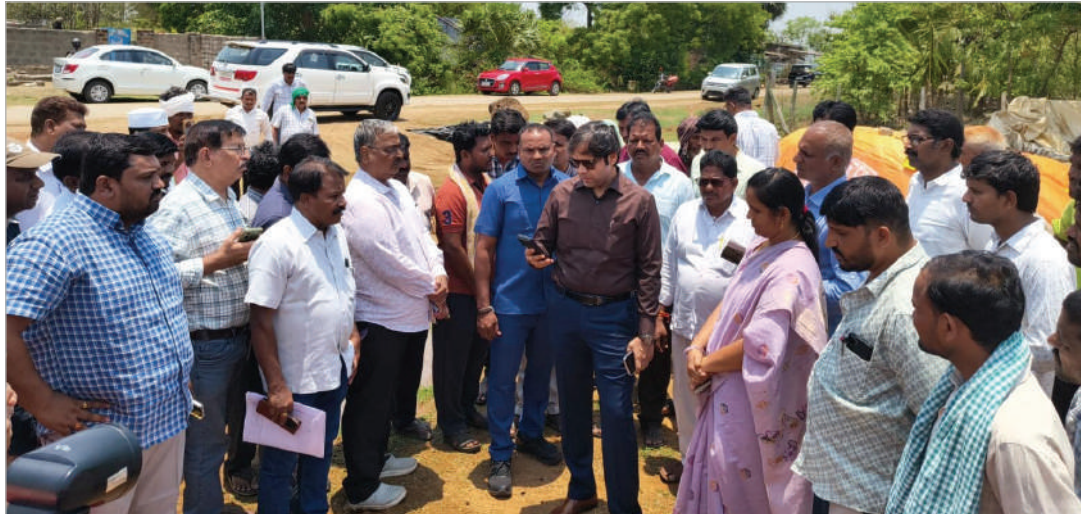
● కొనుగోలు కేంద్రాల వద్ద సరుకు ఉత్పత్తి, నిలువ, రైతులు ఎదుర్కొంటున్న ఇబ్బందులపై కలెక్టర్ ఆరా

ఇల్లందు ప్రతినిధి మే 13,( తరంగాలు): భద్రాద్రి కొత్తగూడెం జిల్లా కలెక్టర్ అంకిత్ బుధవారం రేపల్లె వాడ మొక్కజొన్న కొనుగోలు కేంద్రాన్ని తనిఖీ చేశారు.